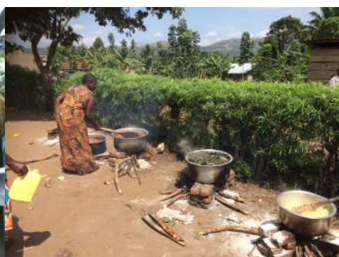
The camp kitchen.