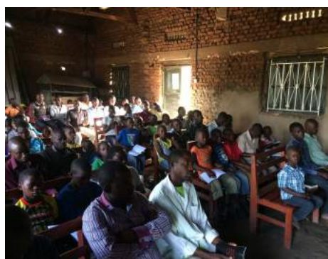
The meeting room was always packed.