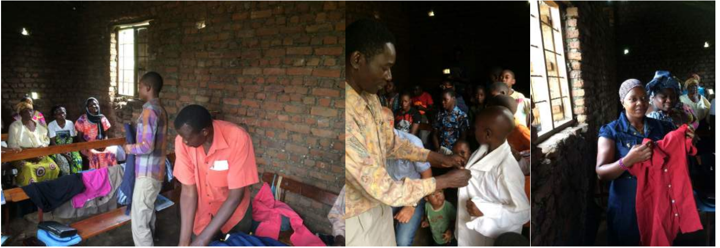
Verdeling van kleding in Kyanduli.