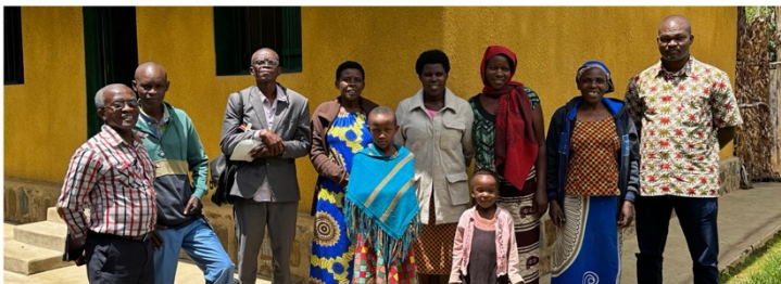
Nyamagabe en Nyaruguru