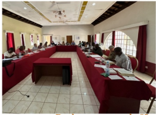
Deelnemers aan de "Southern Bible Conference"

Heilige Geest zei: Zondert Mij nu Barnabas en Saulus af voor het werk waartoe Ik hen heb geroepen. Toen vastten en baden zij, legden hun de handen op en lieten hen gaan.” (Hd. 13:1-3).