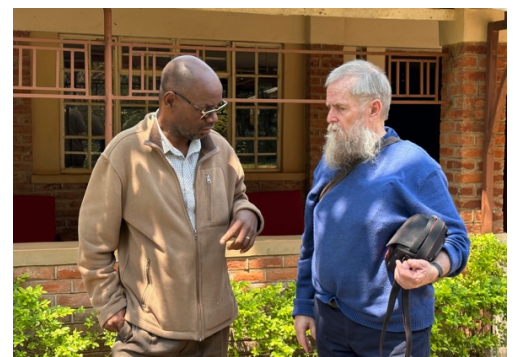
Levendige uitwisselingen van ervaringen gedurende de pauzes