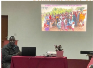
Presentatie over het werk in Kenia