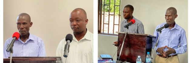
Increasing number of young brothers