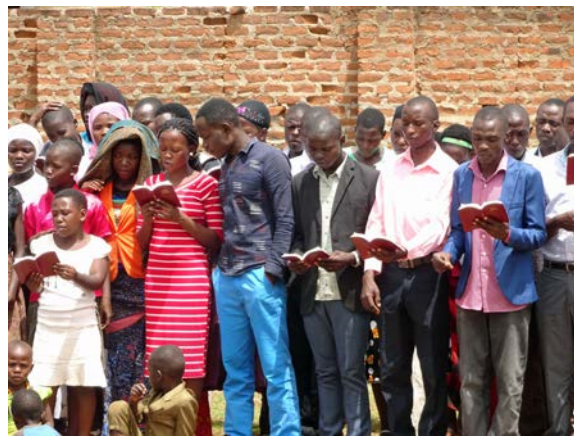
(Opvallend veel jongeren woonden de Bijbel conferentie bij)

Op zondagochtend verkondigden we - broeders en zusters uit andere plaatsen in Uganda, en uit Kenya en Rwanda - samen met de broeders en zusters van de vergadering in Busia, de dood van de Heer. Voor het eerst werd de pasgedrukte liederenbundel in het Luganda gebruikt. Opnieuw bleek hoe groot de invloed is van geestelijke liederen waarvan de inhoud overeenstemt met Gods Woord.