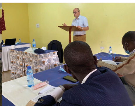
Bijbelstudies over het Lam van God