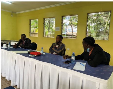
Gesprekken met de broeders uit Kenia