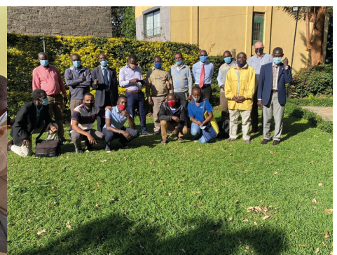
Groepsfoto met enkele van de gasten