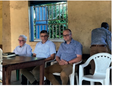
Wachtend op het begin van de volgende studie.