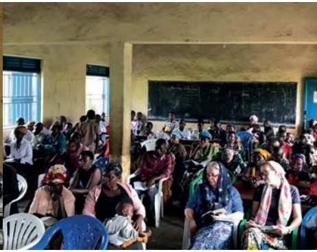
De laatste dag van de conferentie.