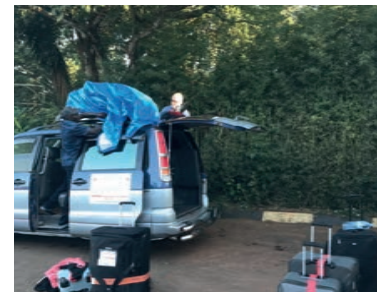
Het inpakken van bus voor de reis naar Mpondwe.