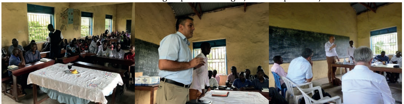
Zondagmorgen, net voor het begin van de samenkomsten.