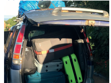
Veel koffers, vanwege de vele lectuur en knutselspullen.