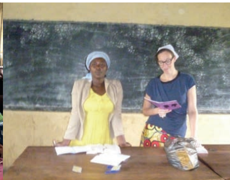
Renate spreekt over Rebekka.