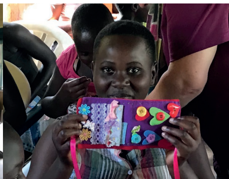
En het naaldenboek is klaar!