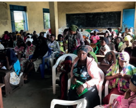
Vlak voor het begin van één van de studies.

Gedurende de studies werden er veel vragen gesteld, zowel in verbinding met het onderwerp, maar ook over andere geestelijke thema's. Op de zaterdag, de laatste dag van het kamp, kwamen Simon,