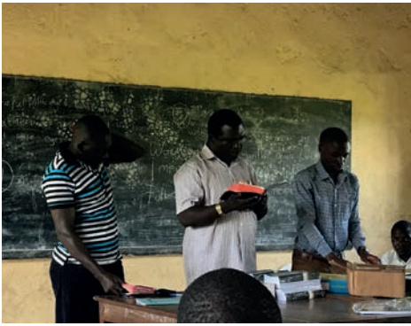
Dubbele vertaling; Luganda-Lhukonzo-Engels