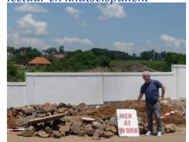
Onderweg naar Mpondwe.