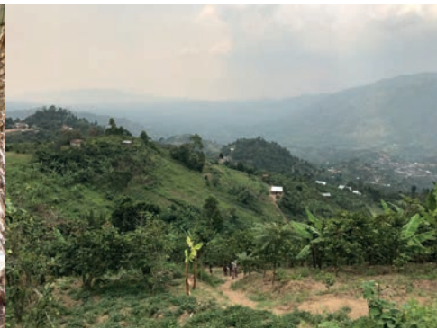
De bergen van Uganda