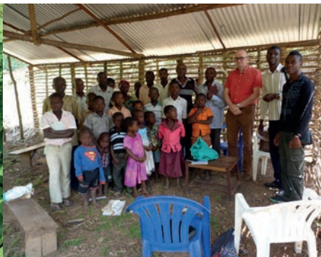
De brs. en zrs. van Mahango in hun nieuwe lokaal, dat nog niet helemaal af is.