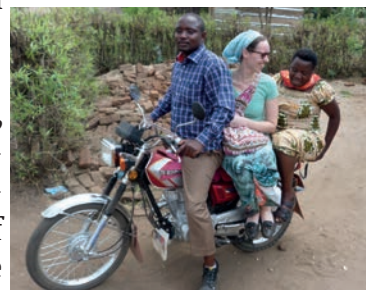
Onderweg naar Rhewingo

Gedurende het kamp voor de meisjes en jonge zusters kon Paul samen met een aantal andere broeders ook een aantal bezoeken in de omgeving maken.