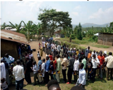
In de rij voor de lunch.

Voor het kamp voor jongens en jonge broeders stonden er geen knutsel- of vergelijkbare activiteiten gepland, hoewel er 's avonds wat tijd was voor sport en spel. Hierdoor konden we veel tijd besteden aan Bijbelstudie en was er ruimschoots tijd om de vele vragen te beantwoorden. Gedurende één van de sessies werd er kort aandacht besteed aan de tabernakel en de broeders vroegen of hier meer over uitgelegd kon worden. Paul heeft daarom op maandagavond nog een PowerPoint presentatie gemaakt met behulp van de foto's van het model van P.F. Kiene. Tijdens eerdere kampen was