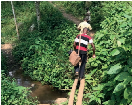
Reizen op het smalle pad... (Busingo area)

Op donderdag bezochten ze de broeders en zusters in Mahango, die recentelijk waren begonnen