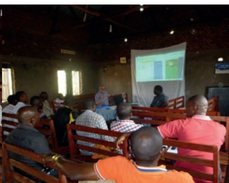
Uitleg van het nieuwe kasboek