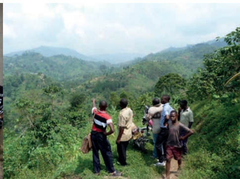
De bergen van Uganda

met de broodbreking. Ze hadden gevraagd om meer onderwijs aangaande de waarheden van de Gemeente. De samenkomst duurde ruim twee uur en zelfs de kinderen luisterden de hele tijd.