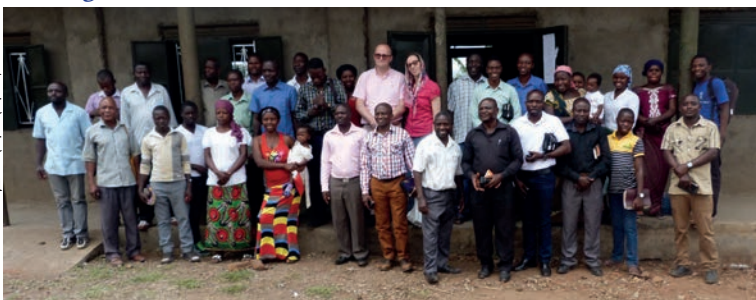
Vijf landen groepsfoto

Op de laatste dag van ons verblijf, de tweede zondag, woonden we eerst de zondagsschool bij. Het was een bijzondere ervaring om het brood te breken met broeders en zusters uit vijf verschillende landen. Het derde vers van lied 20 (Spiritual Songs) heeft ons getroffen.