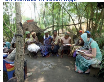
'Hagepreek' in Rhewingo