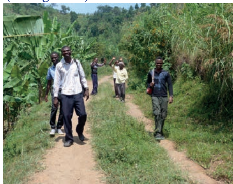
Afscheid in Mahango