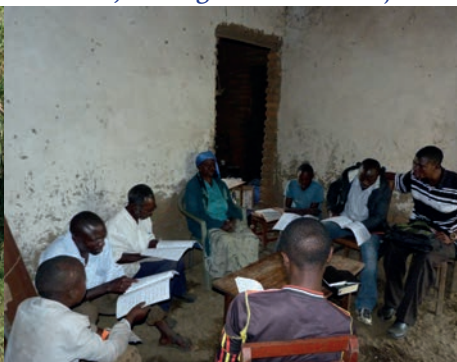
Samenkomst in een huis in Mairukumi