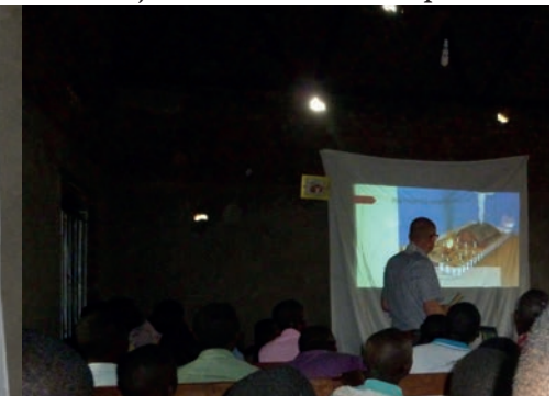
Lessen over de tabernakel.